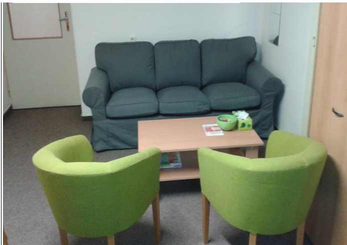
Kancelář soudního tajemníka